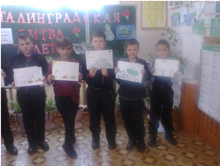
7. Подведение итога.